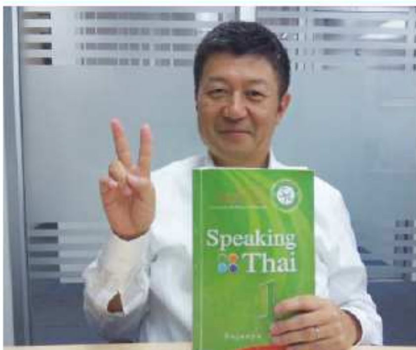
平日お仕事の方向けのレッスンあり