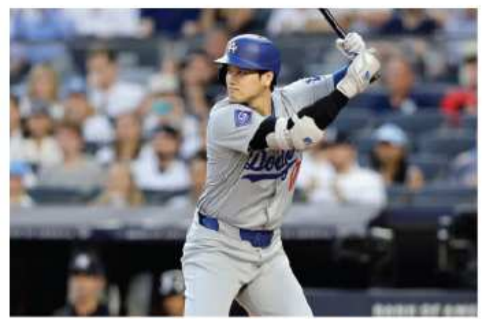
BS、CSではスポーツも充実、見たいチャンネルが揃っています

日本のテレビが見れる タイで日本のテレビを見るなら、全60チャンネルを視聴できる「スマートTV (Smart TV)」がおすすです。