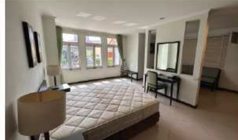
清潔な家具や家電が揃っている