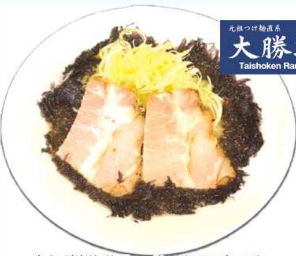
辛ネギ岩海苔ラーメン (230パーツ)

限定メニューをいただく 食欲進むおでんとラーメン こんなにやく、厚揚げ、ごぼう天、さつま揚げ、ロールキャベツ、ちくわ、牛スジの9種類があります。どの具材にもしっかりと味が染み込んでいるのが嬉しいポイントになっています。また、塩味と味噌味から選り食が進みます。場所は、BTSプラカノン駅より徒歩5分。