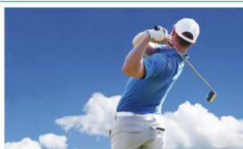
ゴルフによる腰痛