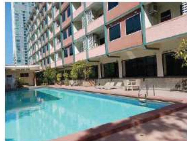
広いプールもございます

BTSのサパーンクワイ駅とアール1駅の間にある「キャピタルマンション」はホテル&サービスアパートとして、短期から長期まで快適に暮らすことができます。最近ではレジャー目的で来タイした日本人の宿泊も多く、部屋が広くて静かな環境で人気上昇中です。近くにはコミュニティモールやスーパー、コンビニ、エンズストアがあり、日本食やタイ料理など、飲食店も豊富にあるので、食事や普段の買い物にも困りません。都心部の高級ホテルに比べると1泊1600