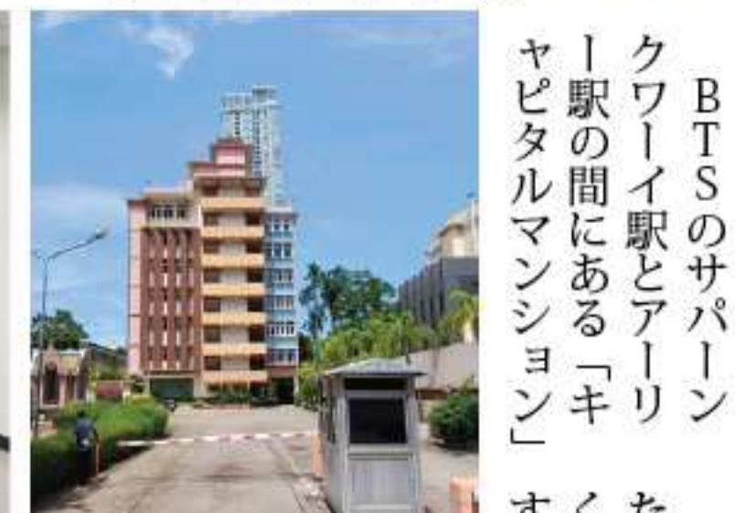
マンションの外観