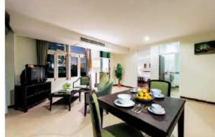
リビングダイニング