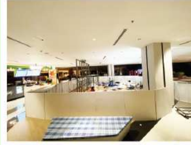
商業施設の深夜作業もバッチリ