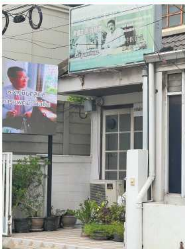
クリニックの外観

中国医学を試み、その効果を確認し、多くの患者に救済を齎した。今年、任期を終えた少年の家族は、3年間暮らした