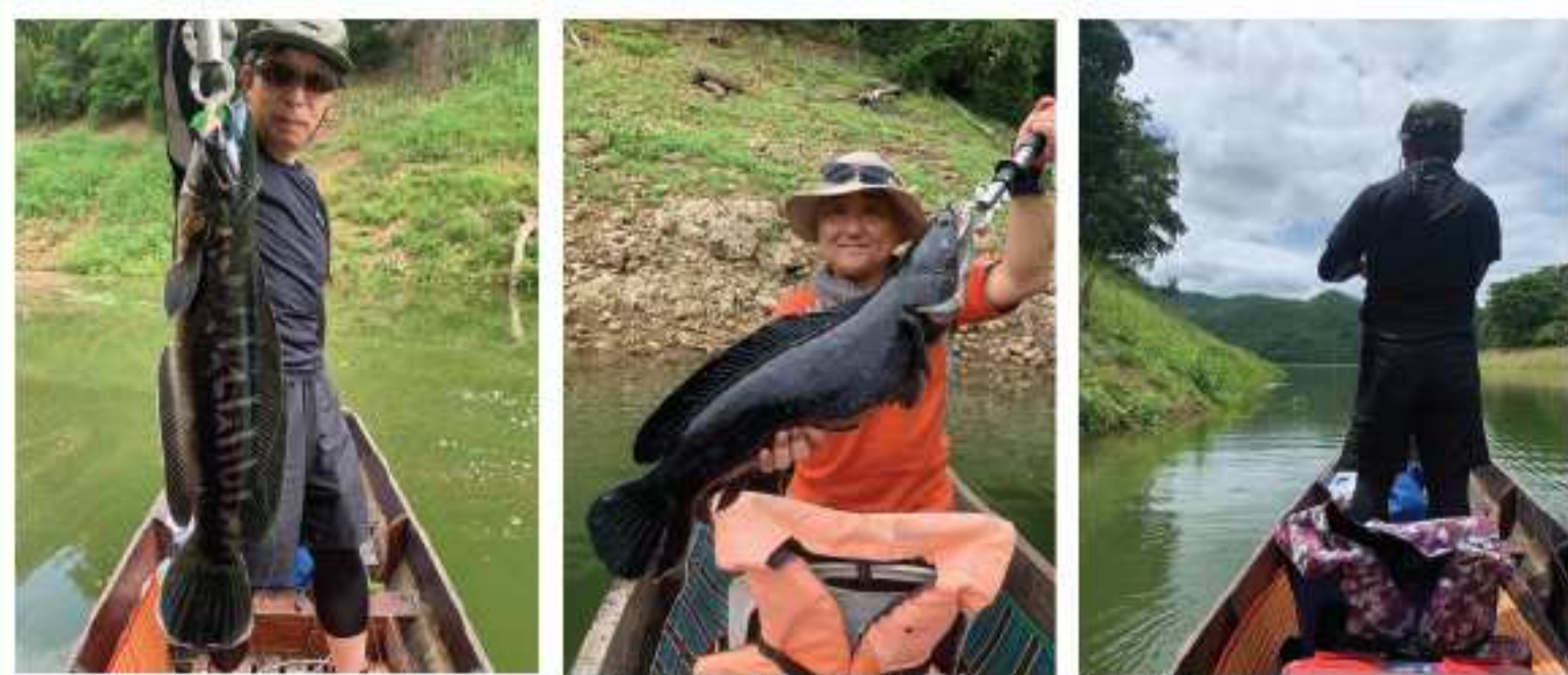
大自然の中で開放的に釣りができる