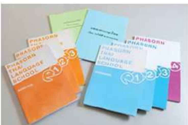
パーソンタイ語学校のオリジナルテキスト

FacebookやLINEなどの公式SNSアカウントでは、定期的に新しい情報を公開しています。グループレッスン開講日や学校への行き方を動画で見られます。右の広告も参照ください。