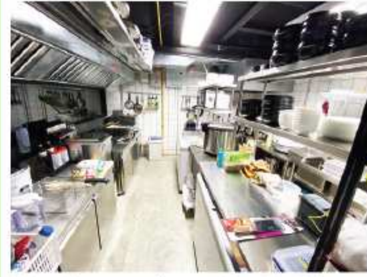
排気ダクト、ガス設備、製氷機配置(製氷排水敷設)など、シェフのご要望通り設計・施工致します。

システム・排気ダクト、製氷機、看板デザイン・制作・設置、P OSシステムやユニフォームの提案など、ワンストップで対応させていただきます。 また、コンドミニアムや戸建てにお住まいの皆様には、各種内装施工、修理、増築、浴槽設置、畳部屋施工、シロアリ被害修復など、さまざまなご要望、お困りごとにお応えさせていただきます。 現地調査、打ち合わせなど、日本人の担当が丁寧に対応致します。どうぞお気軽にご連絡ください。 下の広告も参照で。