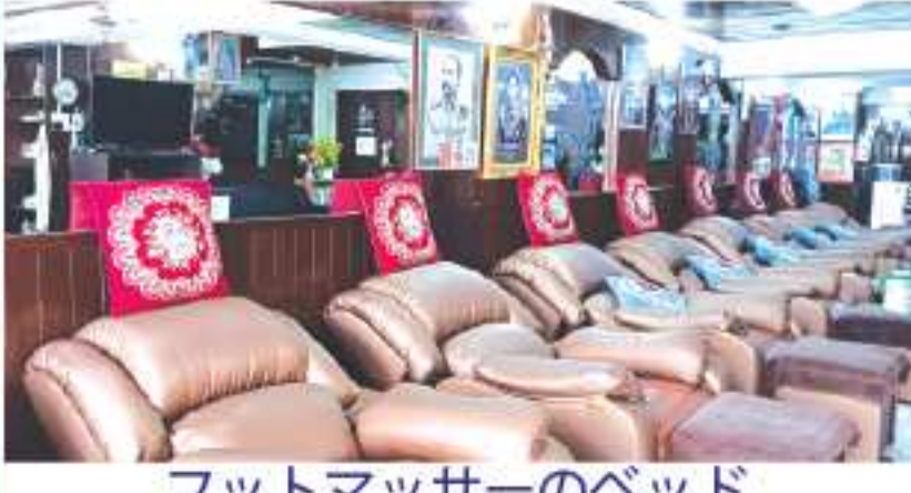
フットマッサージのベッド