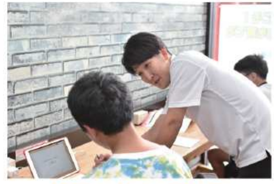
経験豊かな講師がお子様と共に志望校合格を目指します。

無料体験の前にまずはご父兄と面談を行い、お子様の学習状況や勉強に関するお悩み、目標などをお伺いします。お申込みはお電話・メール・LINEより。詳細は下記広告を参照で。