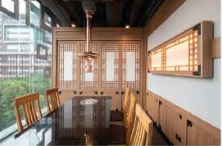
サイアム・ディスカバリーのBORNGAの内装

「総工事期間は約60日間で、計画通りのオープン日に無事に店舗を開店することができました。」