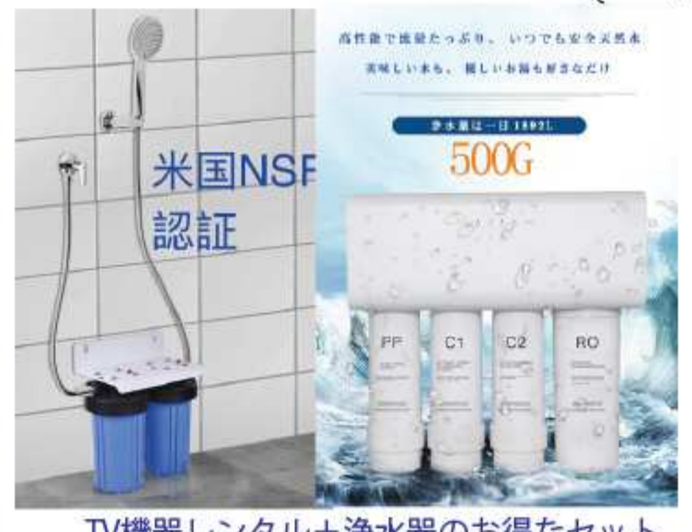
TV機器レンタル+浄水器のお得なセット

TV LINKのテレビボックスは、ネットフリックスやYouTube、タイ語のテレビアプリが付いています。英語の世界のニュースが無料で見られます。テレビボックスは、無料貸出しです。契約終了の方は、返品下さい。契約には、故障時機械無料交換の保証が含まれています。1ヶ月契約は、保証金10000パーツです。視聴者左の広告を参照です。 TV LINKは、日本人とタイ人がペアで設置に伺います。地方の方も訪問致します。 77チャンネルコースは1年契約で12000パーツで映画が8000本以上見られます。1ヶ月録画ですし、高画質です。不具合がめつたにありません。