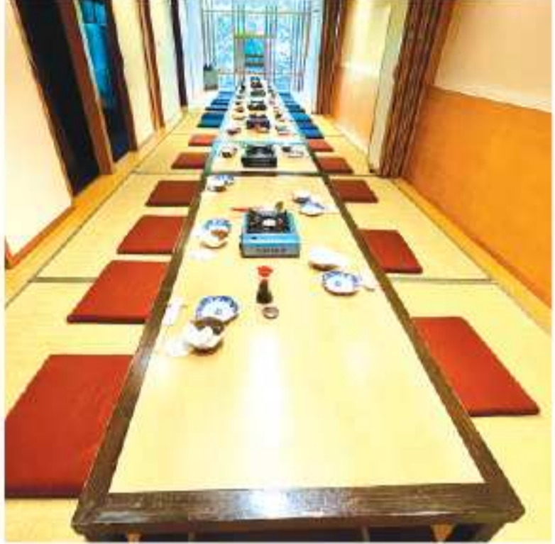
大人数の宴会にも最適な部屋

大人数の宴会にも最適な部屋。場所はスクムビット・ソイ26のフォーウイングホテルの隣にあります。