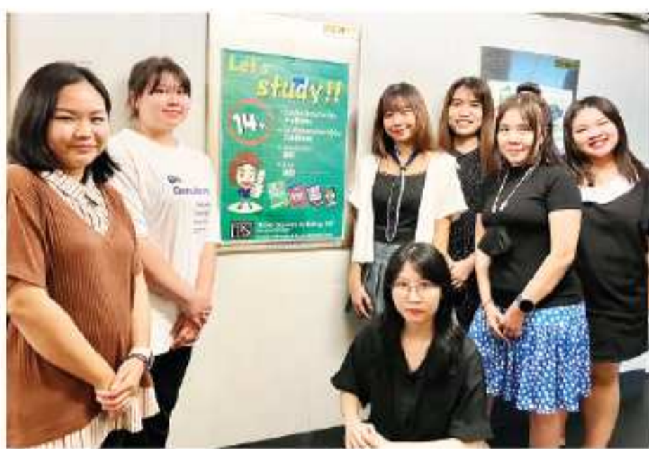
TLSアソーク校の講師陣

毎週(月)(水)正午から13時半。10,500Bで全20日間。教材費込。タイ語初心者の方向け。5名様限定のグループレッスン。 ②【タイ語日曜日コース】 2024年10月27日(日)開講! 毎週(日)13時15分~14時45分まで。10,500Bで全20日間。教材費込。タイ語初心者の方向け。5名様限定のグループレッスン。 ※上記いずれのコースにも教材はテキスト+宿題+発音練習用のCDが付いています。また校内やオンラインでのプライベートタイ語レッスン、タイ人の方への日本語レッスンなどもあり皆様のタイ生活のお手伝いをさせて頂いております。 詳細は当校HP (https://tls-bangkok.com) からご確認頂けます。