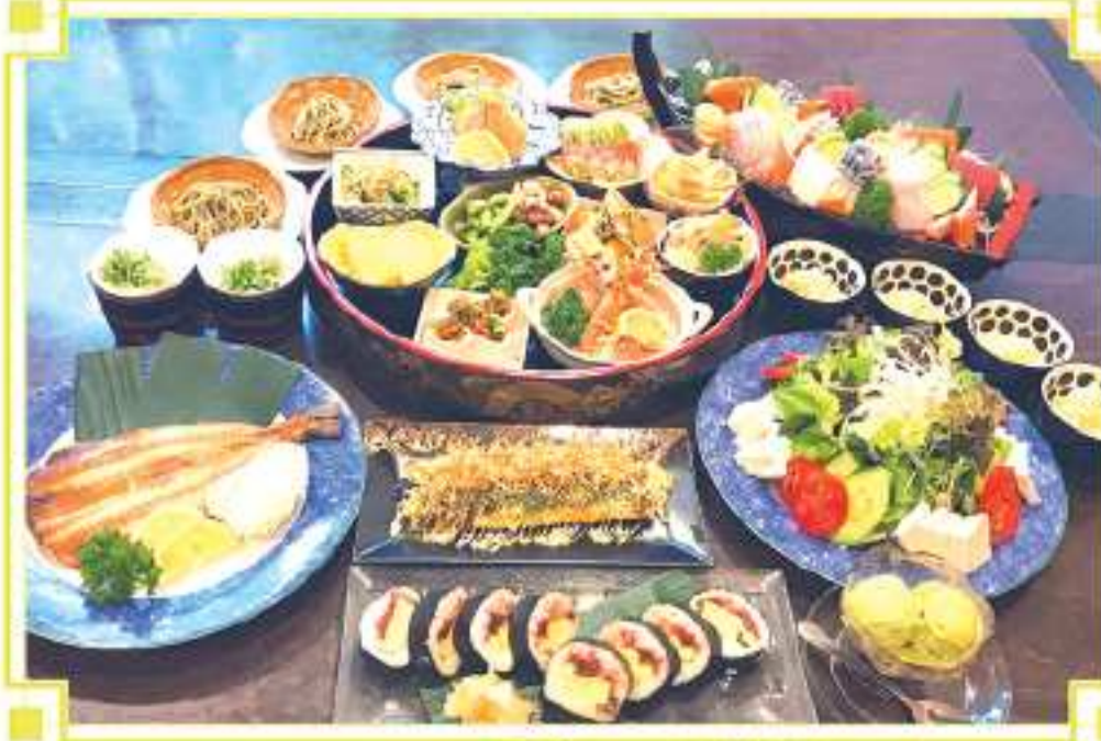
写真は、4名様分です。 600パーツコース (4人分)

600パーツのコースと2時間飲み放題を組み合わせたもので、600パーツのコースには、刺身、サラダ、料理の盛り合わせ、とん平焼き、ほっけ開き、寿司、うどん又は蕎麦、アイスクリームなどがあります。材料の仕入れ状況により、メニューは変更する場合がありますが、このポリシーで600パーツのコースを予約や質問はLINEで気軽にお問い合わせください。7時から22時まで連絡すれば基本5分以内にお返答いたします。