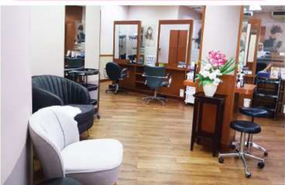
ヘアスタジオバンブー

ヘアスタジオバンブー シャンプー&ブロードライ 300-500B カット+シャンプー&ブロードライ 800-1,200B ヘアカラー&ハイライト 3,000-5,000B パーマ 3,000-5,000B ヘアスパ&トリートメント 3,500-4,500B