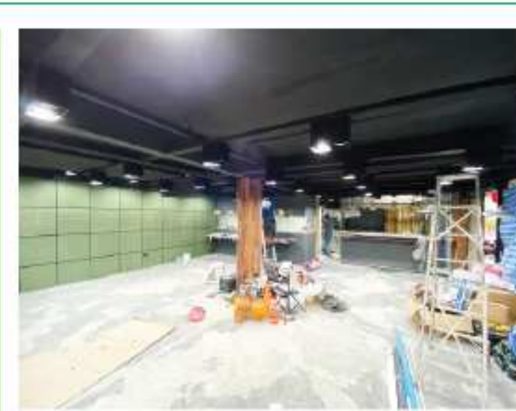
可能な限りSDGSな施工を目指します

弊社、クリエイティブ・スタジオ&システムズは在タイ苦節17年、タイにお住まいの皆様へビジネスや生活をお手伝いさせていただきます。