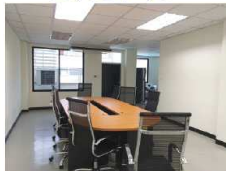
オフィススペースにある会議室