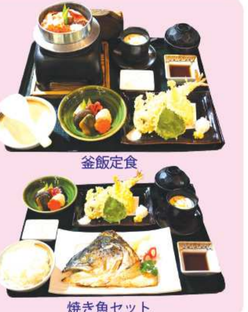
釜飯定食 焼き魚セット

なメニューから選ぶことができます。例えば、日本産新潟米を使用した釜飯定食があります。例え、日本産新潟米を使用した釜飯定食があります。