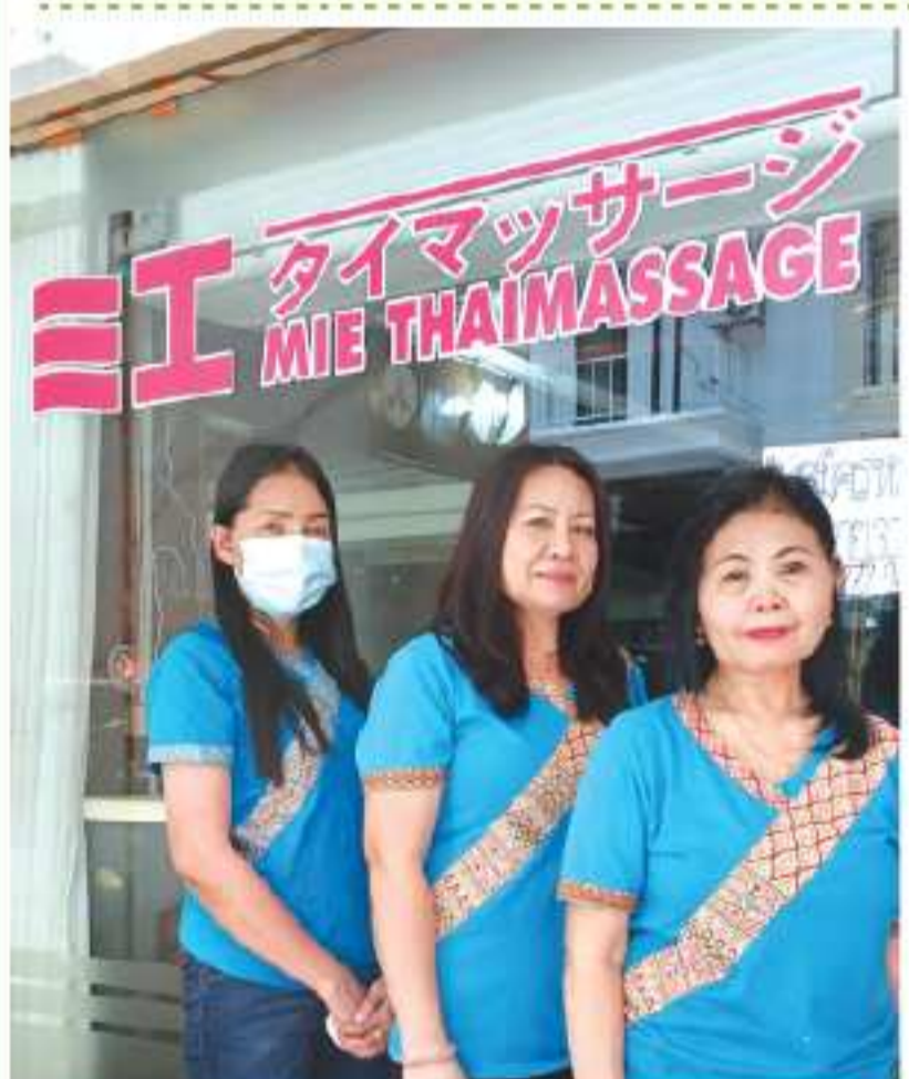
優秀なマッサージ師がいる

ペインアウェイでは腰痛の治療では筋肉のバランスを整えるのと姿勢の歪みを確認して姿勢を治す治療、トレーニングも行っております。またペインアウェイクリニックは日本人経営です。言葉の心配もありません。火曜日と水曜日以外は日本人がいますので、日本語でご相談に乗っております。日本人がいない日でも日本語を