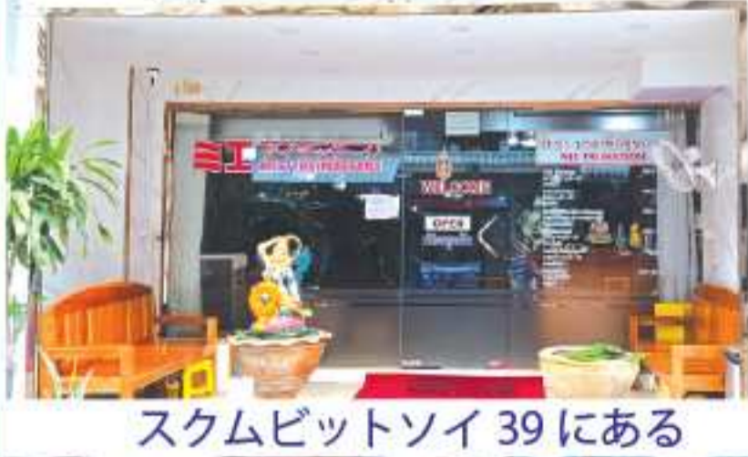
スクムビットソイ 39 にある