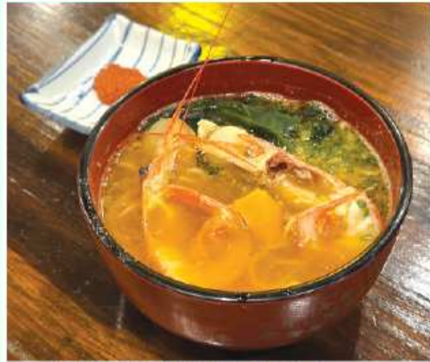
海鮮の旨味を楽しめるラーメン