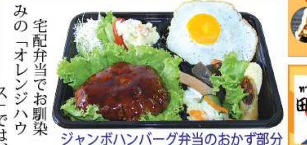
ジャンボハンバーグ弁当のおかず部分

ハンバーグメニュー ニューが充実しています。ボリューム満点の「ジャンボハンバーグ弁当」は定番の人気。ほかには「チーズハンバーグ弁当」(230パーツ)や、小さめのハンバーグがデミグラスソースで煮込まれた「煮込みハンバーグ弁当」(220パーツ)もおすすめです。ハンバーグの中でもあつさりした「和風ハンバーグ」(210パーツ)もおすすめて。また、自宅で最後の調理や仕上げをして出来るまで、お楽しみください。