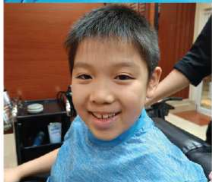
男爵プレミアム お子様のカットも得意