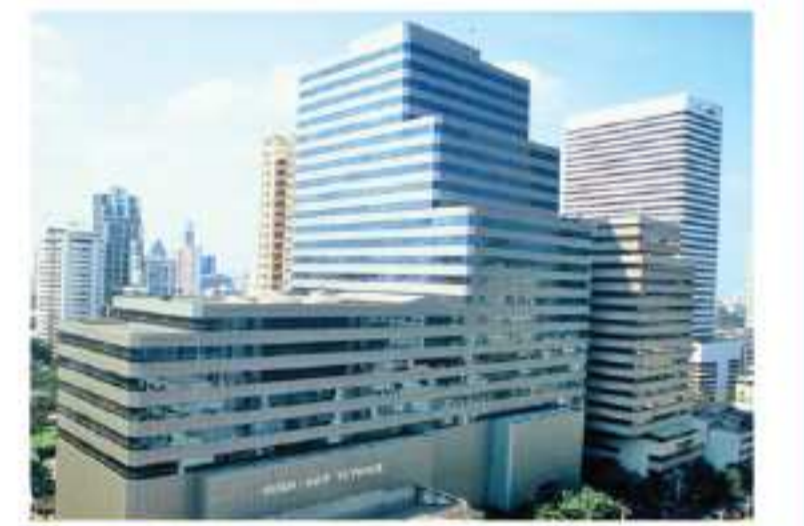
交通至便な TWY OFFICE CENTER ASOKE

バンコクで31年の経験と実績を持つアソーク情報。住まいから店舗・オフィス・投資物件まで、お客様の幅広いニーズにお応えしています。同社が管理している賃貸サービスオフィス「TWY OFFICE CENTER ASOKE」は、ビジネス街で日系企業が集まるアソークのサミットタワー10階にあります。少人数向け短期賃貸も可能なので、少人数でのスタートアップにも便利です。セキュリティも万全で、日系企業のほかに日本の総合大学3校が窓口を設置しております。BTSアソーク駅、地下鉄スクムビット駅の2駅が使えるという通勤が便利なロケーションで、従業員の確保がしやすいという利点もあります。13面の広告内のQRコードから、「TWY OFFICE CENTER ASOKE」のプロモーションビデオをご覧ください。ご興味のある方は、お気軽にご連絡ください。