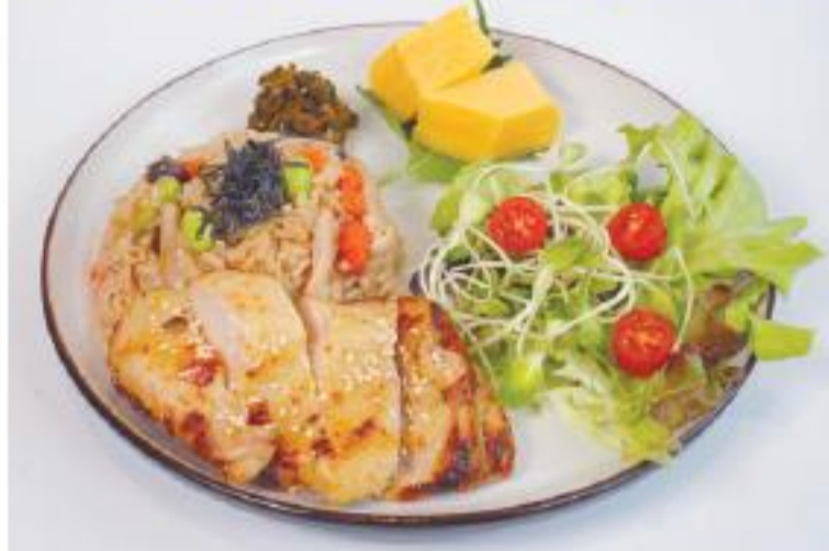
鶏肉の麹味噌焼きと炊き込みご飯