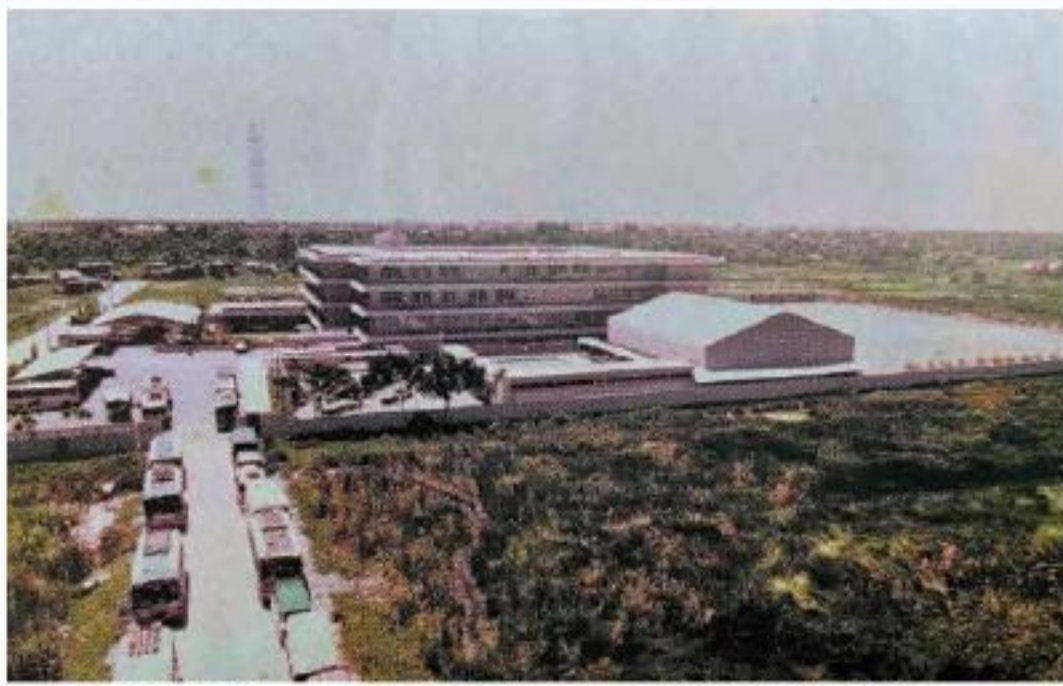
拡張前の校舎全景

しかし遺憾乍ら地主の充分なる理解が得られず、地主側から提出された期限及び地代を検討いたしました。