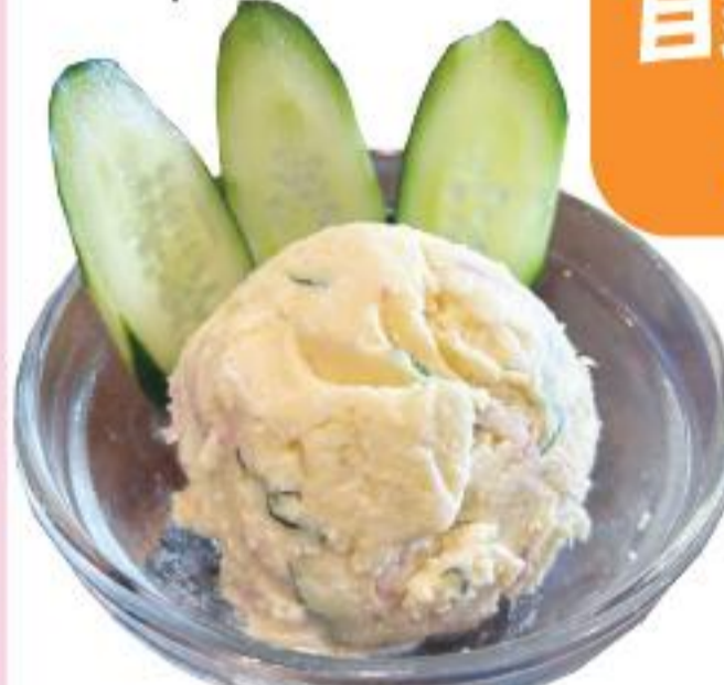
自家製ポテトサラダ 119B