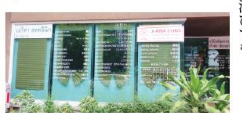
クリニックの外観

OK. クリニックで残った抗生物質を塗りましょう。傷跡が残らないようにしてください。