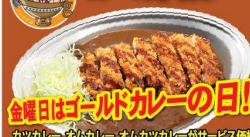
金曜日はゴールドカレーの日!

カツカレー、オムカレー、オムカツカレーがサービス価格 バンコク本店 ■ タニヤ店 スクムビット通り 39 タニヤ通り ソイ 39 に入って約150m右手 営業時間 11:00~店舗により異なる 02-662-5003 02-238-1134 www.facebook.com/GoldCurryBangkok