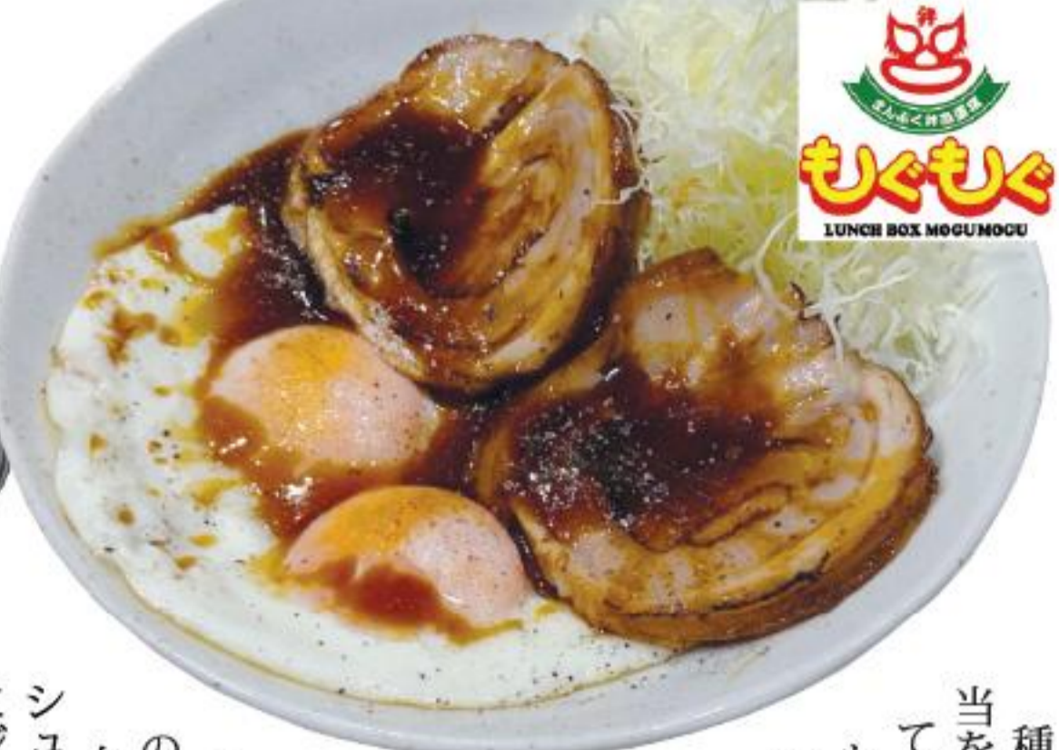
▲チャーシューエッグ弁当 240 パーツ チャーシューエッグ単品 180 パーツ▶

種類豊富なお弁当をデリバリーしてくれる「もぐもぐ」に、豪華な新メニューが登場しました！ 『チャーシューエッグ弁当』(240パーツ)、『チャーシューエッグ単品』(180パーツ)の登場です。 自家製チャーシューが、さらにジューシーにリニューアルしました。 贅沢な厚切りチャーシューに、目玉焼きを添えた満足感たっぷりの一品。 デリバリーだけでなく、出来立てをいただける店内飲食もおすすめです。 店内飲食では、豚汁とご飯、日替で。