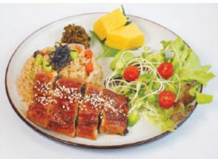
うなぎ蒲焼きと炊き込みご飯