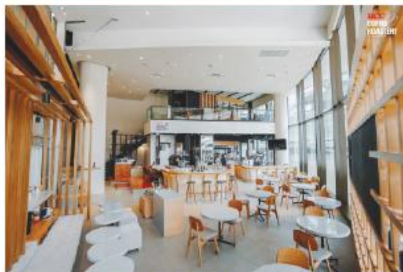
エカマイ・ゲートウェイのUCCコーヒーロースタリー