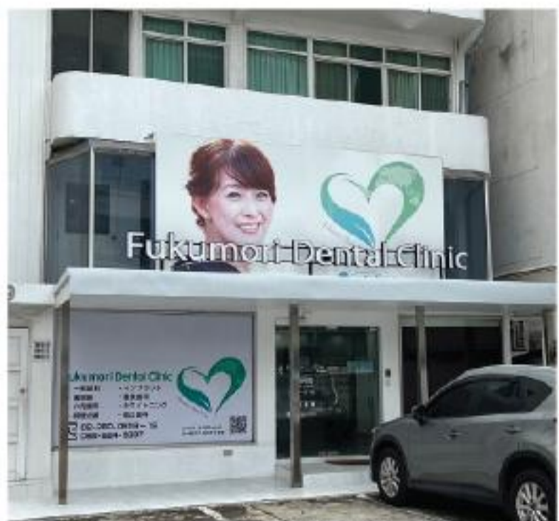
最大8台分の駐車場があり便利