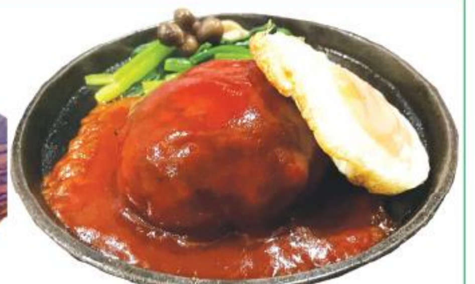
うちのかあちゃんのハンバーグ 220B

『牛すじ煮』『枝豆』『大根漬け』などあります。 自家製ポテトサラダは、素朴な味わいがクセになると、密かな人気メニュー