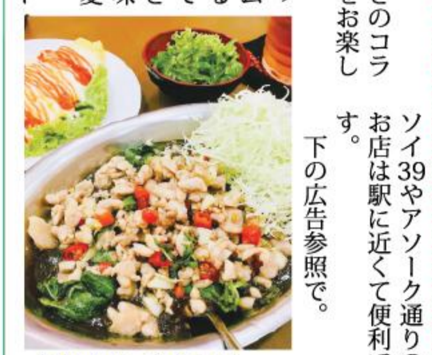
個性的なガパオカレー

濃厚さと辛さのコラボレーションをお楽しみください。 さらに、トッピングにはオムレツを追加するのもおすすめです。まろやかさが加わり、一味違う一品に早変わり。 スクムビット