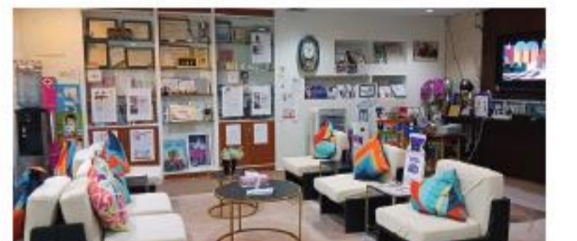
クリニックの待合室