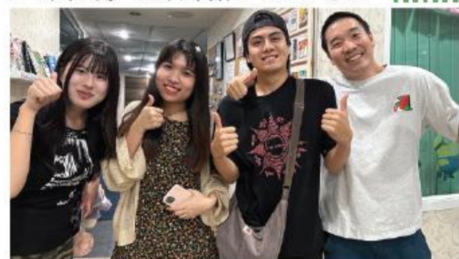
TLSの先生はいつもフレンドリー