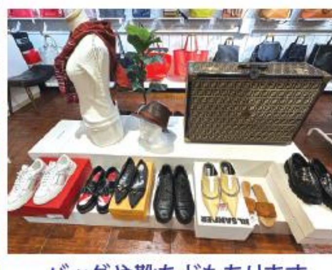
バッグや靴などもあります