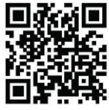
携帯での視聴の様子

2. アンドロイド携帯 or iphone のみ (本体契約なし) 800 バーツ / 月、 8,000 バーツ / 年 (10ヵ月+2ヵ月サービス)