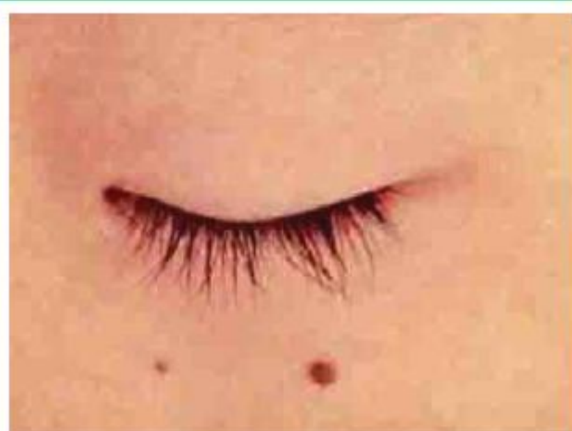
ホクロ取りはお任せください