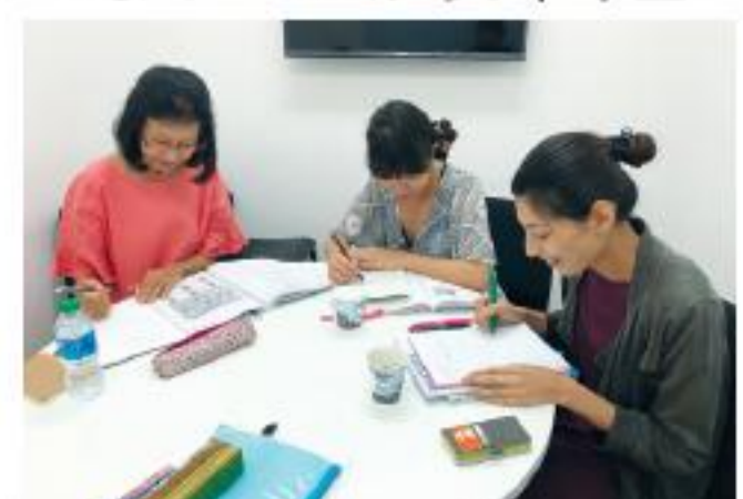
タイ語のグループレッスン

昼: 個人レッスン 60分 (55分+5分休憩) 30レッスン 17,100B (1時間あたり570B) 60レッスン 32,400B (1時間あたり540B) 30レッスン 45,900B (1時間あたり510B)