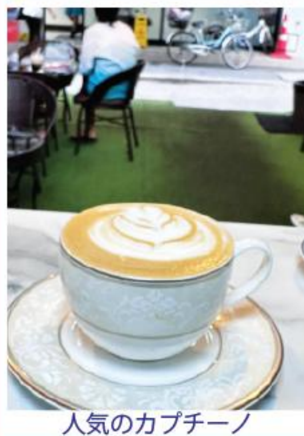
人気のカプチーノ

朝の出動前に、ランチの後に、午後の休憩に。ふらっと立ち寄り、気軽に一杯、ほっと一息。スクムビット・ソイ41のオアシス的な存在のカフェ「フォティーワン・コーヒー」は、終日様々な人が訪れる憩いの場所です。チェンマイ産のアラビカコーヒー豆を使用したコーヒーは、雑味の少ない自由ランドオフィスの1階にあります。 フォティーワン・コーヒー ソイ41のオアシスカフェ テラスのソファ席が心地のよい空間です。人気のカプチーノ、すっきりとした味わい、フレッシュな果物を使用したスムージーも人気です。マンゴー、スイカ、ココナッツなど様々なドリンクがあります。オープンテラスのソファ席が心地のよい空間です。人気のカプチーノ、すっきりとした味わい、フレッシュな果物を使用したスムージーも人気です。マンゴー、スイカ、ココナッツなど様々なドリンクがあります。