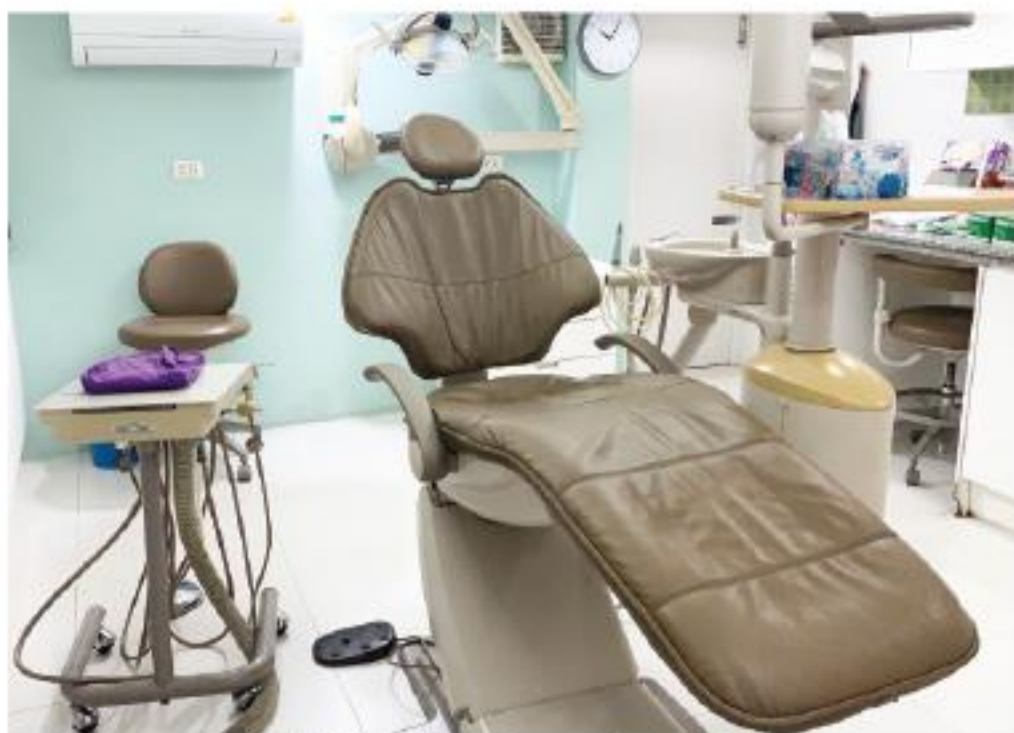
福森歯科クリニックの診察室