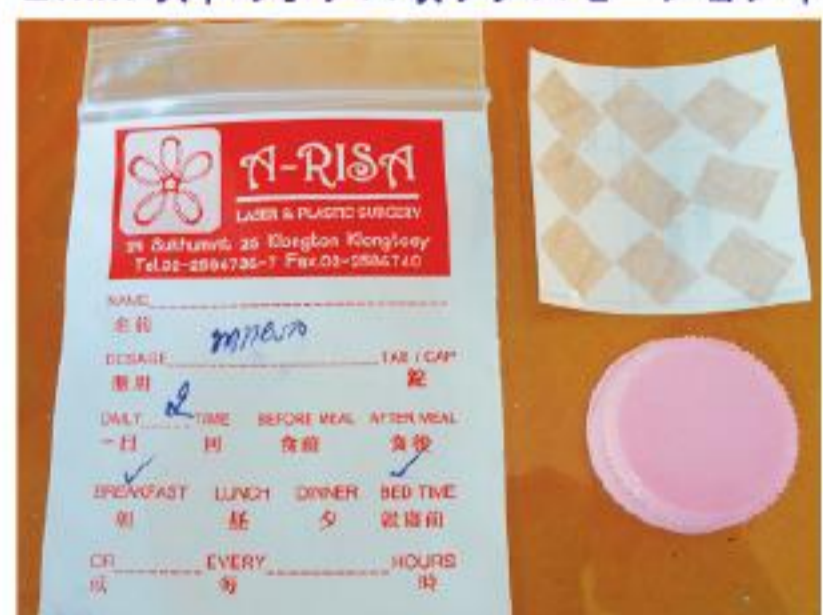
傷が治るまで抗生物質を塗ります

OK. クリニックで残った抗生物質を塗りましょう。傷跡が残らないようにしてください。