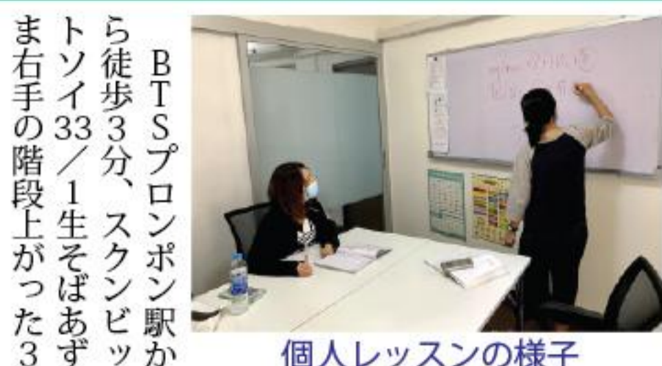
個人レッスンの様子