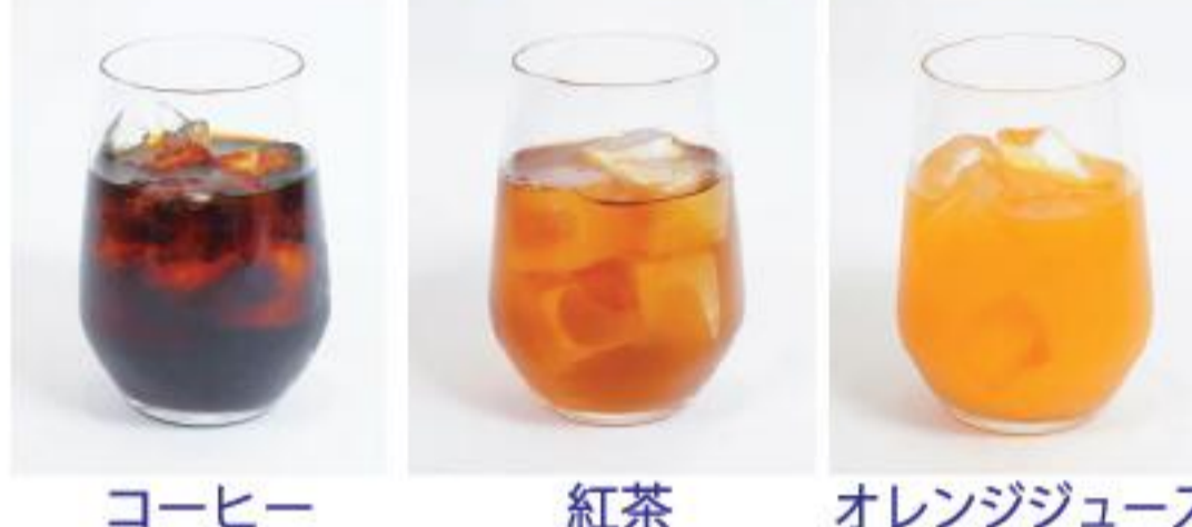
コーヒー 紅茶 オレンジジュース

ドリンクはコーヒー、紅茶、オレンジジュースの3種類からお選びいただけます。デザートには、当店自慢の豆腐プリンが付いてきます。香り高く、甘く、バランスの取れた豆腐プリンです。これだけで一食分の満足感が得られます。ドリンクとデザートもセットに無料