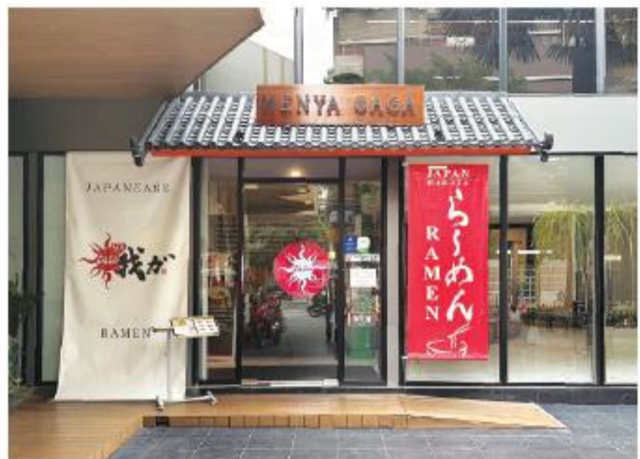
ソイ24のアリソンホテル1階の店舗

自分がここでやろうとしていることは、ラーメンを作ることじゃない。先代と社長が命を削るようにして守ってきた味、その魂をそのまま器に宿し、地球の裏側まで届けること。そして、どこの国の人間だろうと、一口すすった瞬間に笑顔になれる一杯を出すこと。 言葉にすれば、それだけだ。だが、現実には容赦なかった。タイ語は一言もわからないまま、飛行機を降りた。現地スタッフに何かを伝えようとするたび、言葉の壁に跳ね返される。文化が違う、ものの見方が違う。「なぜ伝わらないんだろう」という焦りが、じわじわと積み重なっていった。