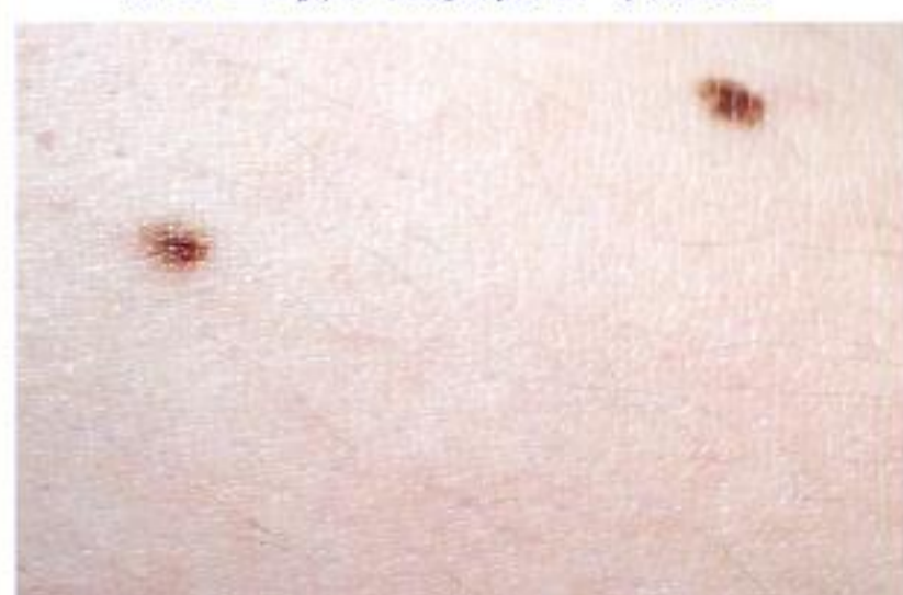
2mm 以下のホクロ取りプロモーション中