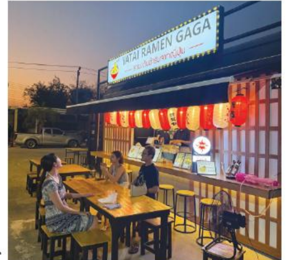
4月にオープンした「屋台ラーメン我が」

麺屋我が バンコク店/屋台ラーメン我が (トレインナイトマーケットラチャダー) お待ちしています。下の広告も参照で。