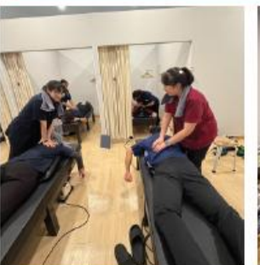
スタッフ合同勉強会の様子