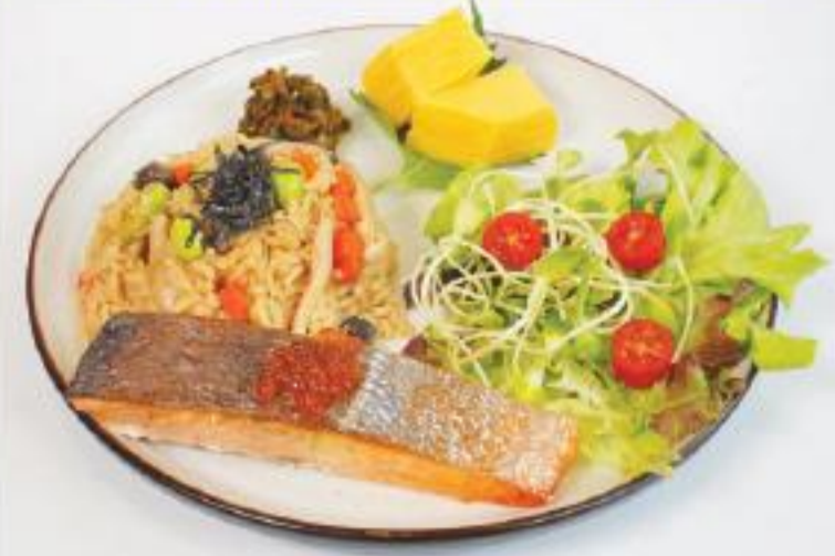
サーモン焼き&いくらと炊き込みご飯