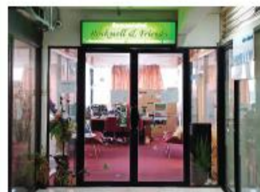
ターミナルビル4階にあります